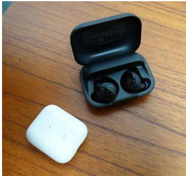
کیس شارژ اکوبادز و ایرپاد ۲

عمر باتری ایرپاد WF-1000XM3 سونی، با یک بار شارژ و در صورت فعال بودن حذف نویز، ۶ ساعت و در غیر این صورت ۸ ساعت است. کیس شارژ آن نیز عمر باتری را به ۳۲ ساعت افزایش می‌دهد که اگر امکان حذف نویز فعال باشد این زمان به ۲۴ ساعت تقلیل می‌یابد. پاور بیس با ۹ ساعت و جیرا الیت ۷۵ تا ۷ ساعت شارژدهی توانایی مناسبی در این زمینه دارند که البته این آمار به لطف کیس خود به ترتیب به ۲۴ و ۲۸ ساعت افزایش خواهد یافت.