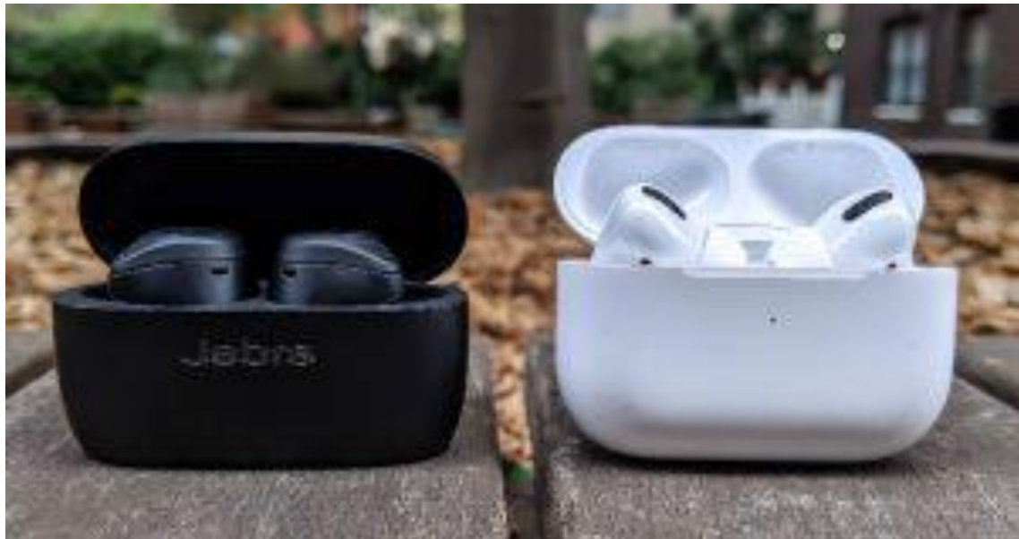
کیس شارژ جبرا الیت و ایرپاد ۲