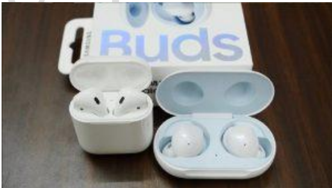
کیس شارژ گلکسی بادز و ایرپاد ۲

عمر باتری اکوبادز آمازون با یک بار شارژ ۵ ساعت است که اگر همراه با کیس شارژ آن باشد به ۲۰ ساعت می‌رسد. سرفیس ایرپادز نیز با هر شارژ کامل، توانایی پخش موسیقی تا ۸ ساعت را خواهد داشت که با استفاده از شارژ ذخیره‌ی موجود در کیس شارژ عمر باتری آن به ۲۴ ساعت خواهد رسید.