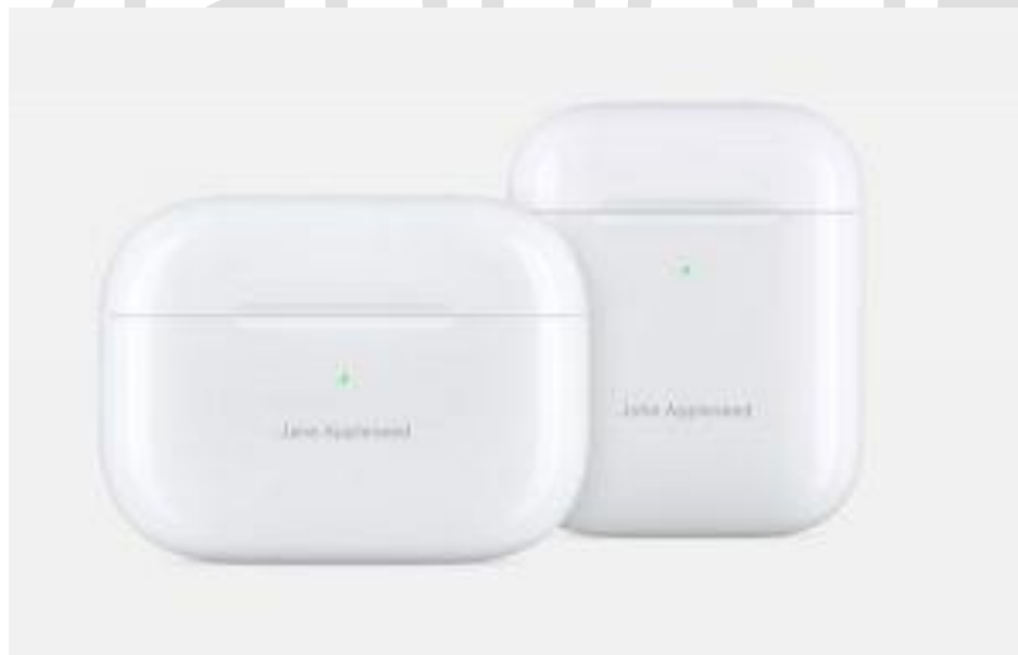
کیس شارژ ایرپاد پرو و ایرپاد ۲

عمر باتری در مورد بیشتر ایربادهای کاملاً بی‌سیم، نکته‌ی مهمی است که گاهی به برهم خوردن معامله می‌انجامد. عمر باتری ایرپاد پرو بسیار شبیه به ایرپاد نسل دوم است. با یک بار شارژ ۵ ساعت شارژدهی خواهد داشت که در صورت فعال بودن حذف نویز این زمان به ۴٫۵ ساعت کاهش می‌یابد؛ اگر کاربر در همین حالت مشغول مکالمه با تلفن نیز باشد عمر باتری به ۳٫۵ ساعت می‌رسد. اگر ایرپاد همراه با کیس شارژ خود باشد شارژدهی گوش دادن به موسیقی به ۲۴ ساعت و برای مکالمه‌های تلفنی به ۱۸ ساعت می‌رسد.