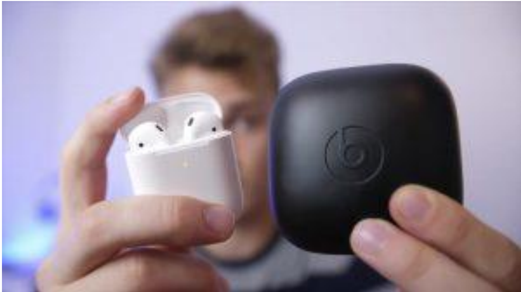
کیس شارژ پاوربیتس و ایرپاد ۲