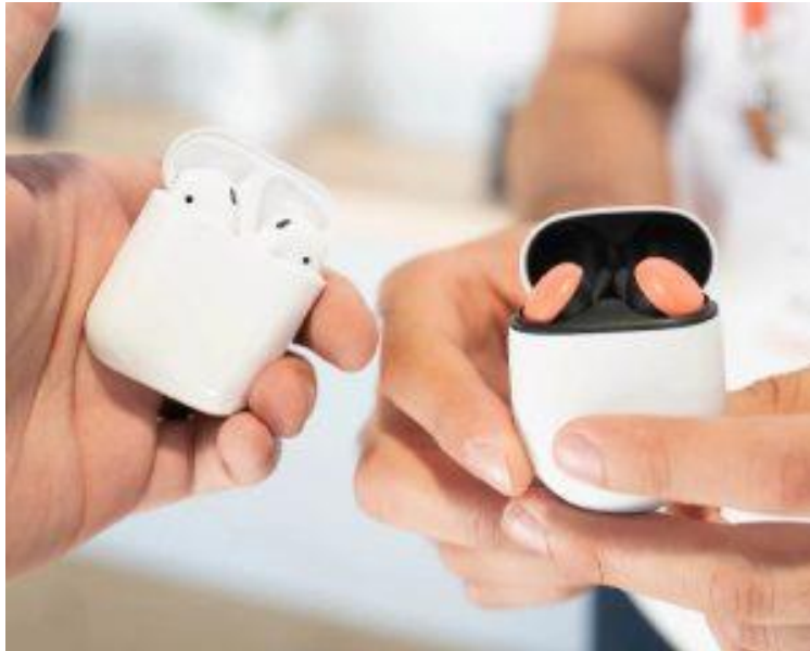
کیس شارژ گوگل بادز و ایرپاد ۲

عمر باتری اپل ایرپاد ۲ با هر شارژ ۵ ساعت و برابر با نسل جدید گوگل پیکسل بادز است. هر دو دستگاه همراه با کیس شارژ عرضه می‌شوند که امکان شارژ و استفاده از آن‌ها تا ۲۴ ساعت را فراهم می‌کنند. عمر باتری سامسونگ گلکسی بادز با یک بار شارژ ۶ ساعت خواهد بود. اما کیس شارژ آن تنها ۷ ساعت شارژ اضافه در اختیار کاربر قرار خواهد داد که میزان کارکرد کل را به ۱۳ ساعت می‌رساند. البته می‌توان با گلکسی اس ۱۰ و قابلیت شارژ بی‌سیم معکوس آن، این ایرپاد را به‌صورت بی‌سیم شارژ کرد.